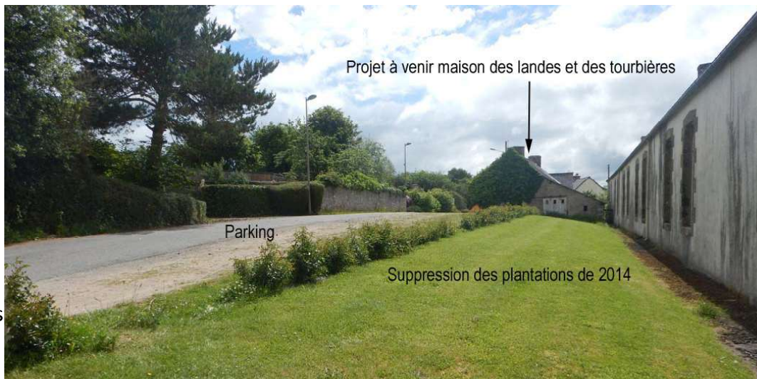
2021 pelouse bordée d'une ligne de rosiers, séparant du stationnement latéral

Bien déterminer l'ensemble des usages avant de dessiner un projet