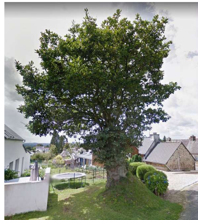
Rue de l'école un Chêne trogne remarquable à protéger