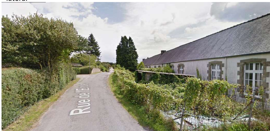
2014 ancien potager, pas de stationnement