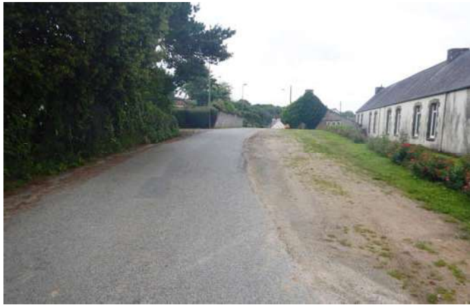
Rue de l'école, voie dégagée induisant Les automobilistes à rouler vite.